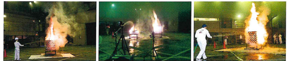
(於:総務省消防研究センター)